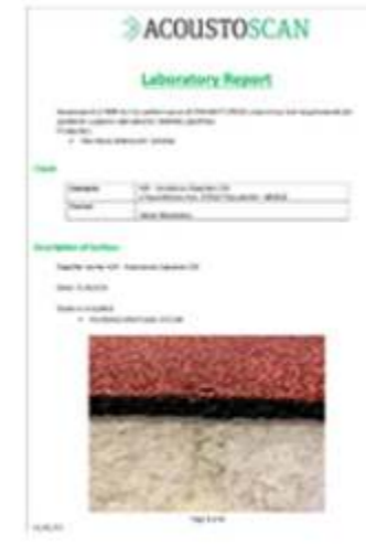
POLTRACK SPRAYCOAT EN 14877