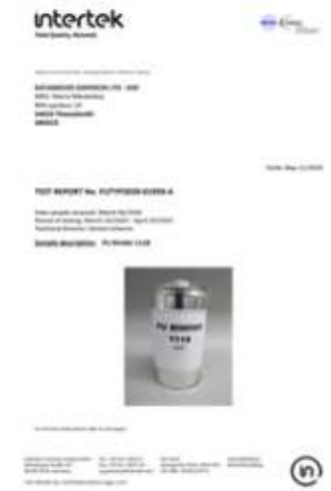
PAH TEST REPORT PU BINDER 1118