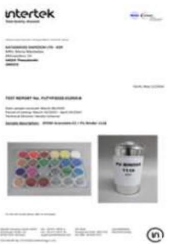
PAH TEST REPORT PU BINDER plus EPDM 856