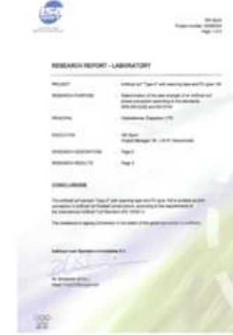
PU GRASS 149