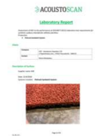
POLTRACK SANDWICH EN 14877