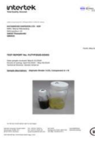
PAH TEST REPORT PU BINDER 1125 AL