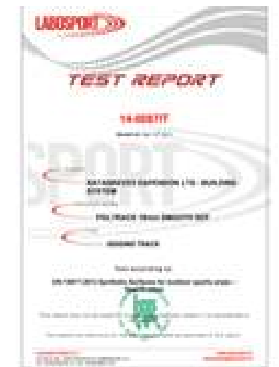
POLTRACK JOGGING TRACK