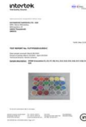
PAH TEST REPORT EPDM 856