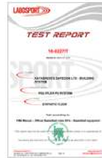
FIBA POLYFLEX PU