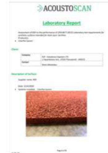
COLORFLEX EN 14877