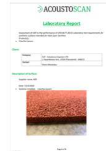
COLORFLEX EN 14877