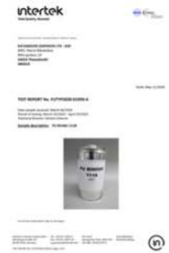
PAH TEST REPORT PU BINDER 1118