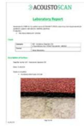
POLTRACK SPRAYCOAT EN 14877