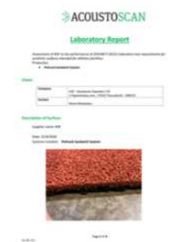
POLTRACK SANDWICH EN 14877