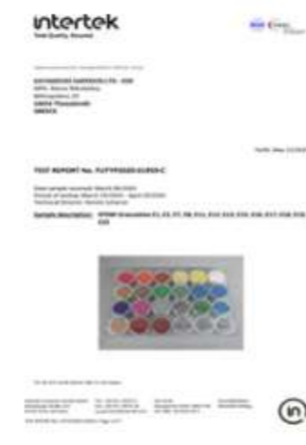
PAH TEST REPORT EPDM 856