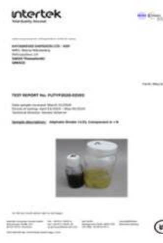
PAH TEST REPORT PU BINDER 1125 AL