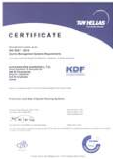
ISO KDF Ltd