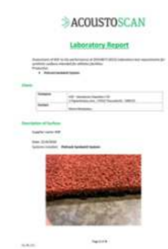
POLTRACK SANDWICH EN 14877