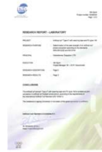
PU GRASS 149