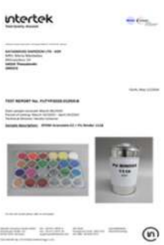
PAH TEST REPORT PU BINDER plus EPDM 856